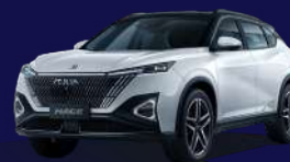
Dual White & Black