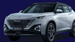
Dual Silver & Black