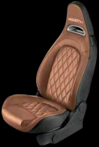
جلد طبيعي Natural leather