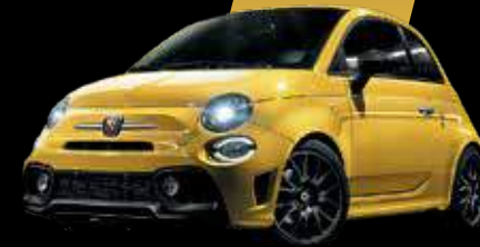
أصفر مودينا Modena Yellow