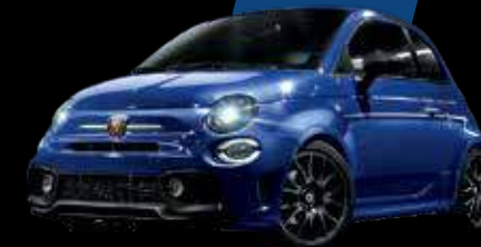
أزرق بوديو Podio Blue