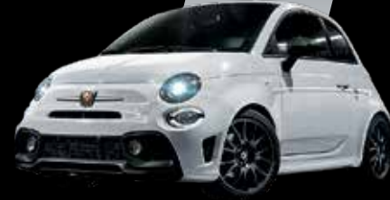
أبيض غارا Gara White