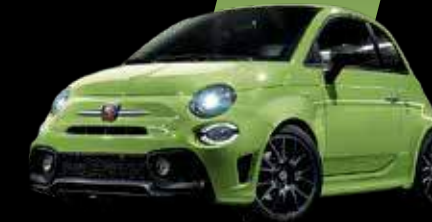
أخضر أدرينالين Adrenaline Green