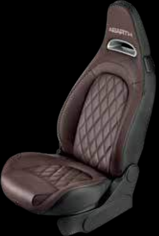
جلد بني هيلمت Helmet brown leather