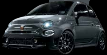
رمادي بيستا Pista Grey