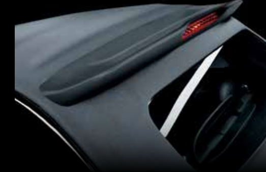
قماش رمادي Grey fabric