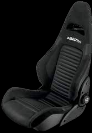
قماش سابلت® جي تي Fabric Sabelt® GT