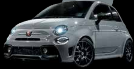
رمادي كمبوفولو Campovolo Grey