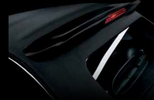
قماش أسود Black fabric