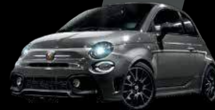
رمادي ريكورد Record Grey