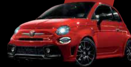
أحمر أبارث Abarth Red