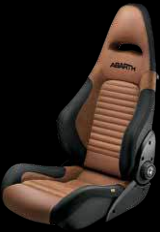
جلد توباكو سابلت® جي تي Tobacco leather Sabelt® GT