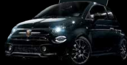
أسود سكوربيون Scorpione Black