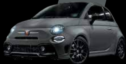
رمادي أسفلت Asfalto Grey