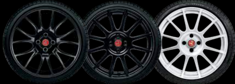
17" إنش فورمولا