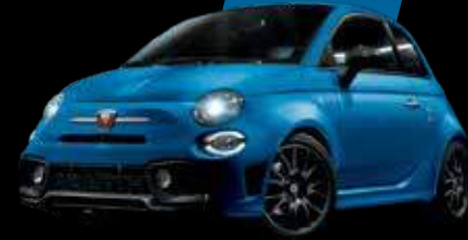
رالي أزرق Rally Blue