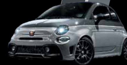
رمادي بيستا / رمادي كمبوفولو Pista Grey / Campovolo Grey