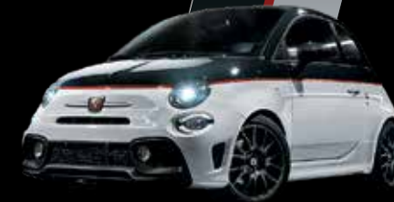
أسود سكوربيون / أبيض غارا Scorpione Black / Gara White