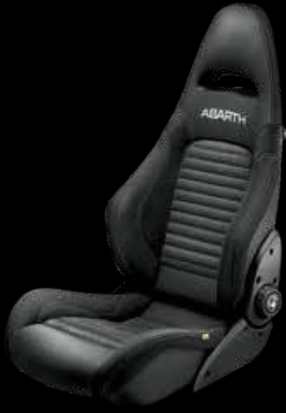
جلد أسود سابلت® جي تي Black leather Sabelt® GT