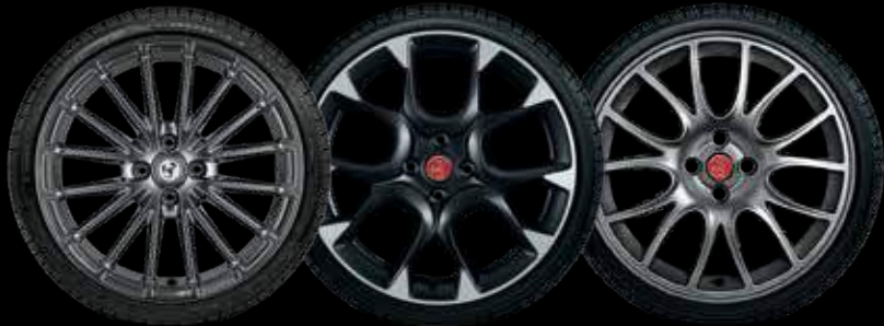
17" إنش مونتي كارلو

• as standard ◦ optional - not available